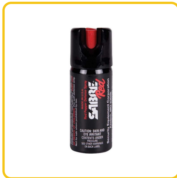
Gas Pimienta SABRE Red · Disparo en Cono — contenido neto 45 g — disponible en armasmys.com