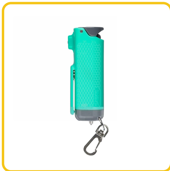
Gel Pimienta SABRE Red 3 en 1 Safe Escape — con rompecristales y cortacinturones

El 3 en 1 Safe Escape combina gel de pimienta SABRE Red para defensa personal con un rompecristales y un cortacinturones integrados, pensados para emergencias vehiculares. Ideal para viajeros y para quienes conducen solas: defensa a distancia y un medio de escape si quedas atrapado tras un choque o una inmersión.