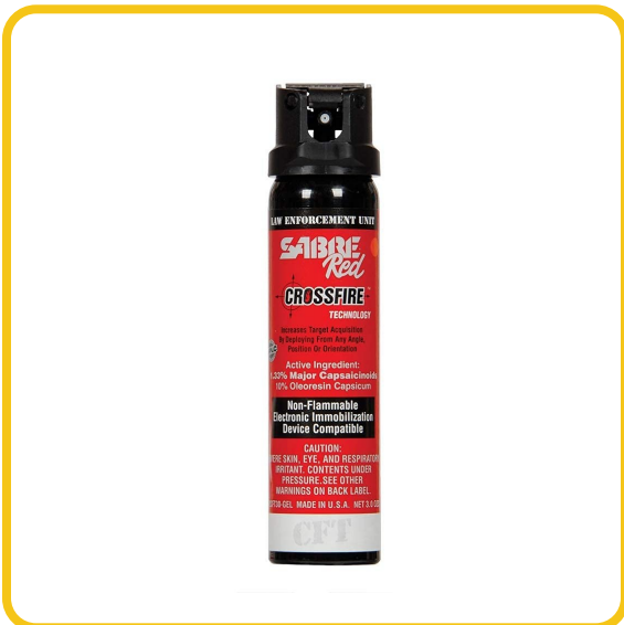
SABRE Red Crossfire — Flip Top 3 oz (85 g)

Es el de MAYOR alcance y capacidad de toda la línea de gel. Su sistema Crossfire —grado fuerzas del orden— permite dispararlo en cualquier ángulo, incluso de cabeza, y sus 85 g rinden hasta 32 ráfagas. Pensado para uso intensivo, seguridad profesional o para quien quiere el máximo número de disparos.