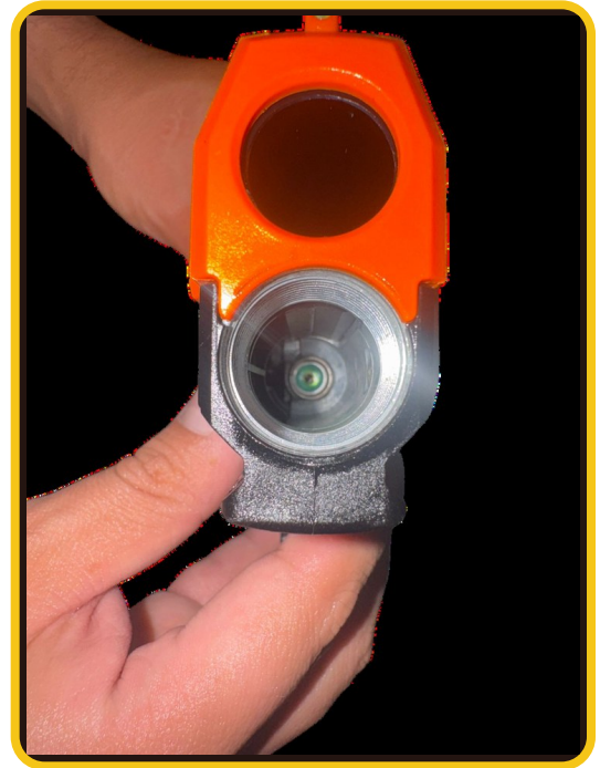
Lubricación de la válvula y el O-ring

El gas CO2 se expande a temperaturas extremadamente bajas. La exposición constante a este frío congelante y la falta de lubricación provocan que el empaque se petrifique (pierda su elasticidad, se reseque y se agriete).