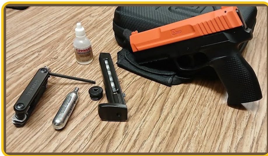
Secure 68 con tanques de CO2 de 12 g y munición cal. .68

¿Por qué es obligatorio este paso? Si se retira un tanque que aún contiene presión de forma abrupta, se genera una liberación violenta y repentina de gas a una temperatura extremadamente baja. Esto produce una exposición excesiva y de golpe del empaque ante el CO2 congelante, congelándolo instantáneamente y provocando su deformación, desgarro o desprendimiento de su asiento.