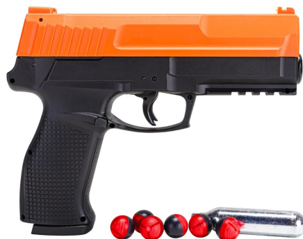
Secure 68 con munición cal. .68 y tanque de CO2 Umarex