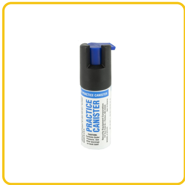
Spray Pimienta de Práctica SABRE Red (inerte) — disponible en armasmys.com

El Spray de Práctica SABRE (inerte, solo agua) replica el peso, presión y patrón del modelo real. Disponible en armasmys.com .