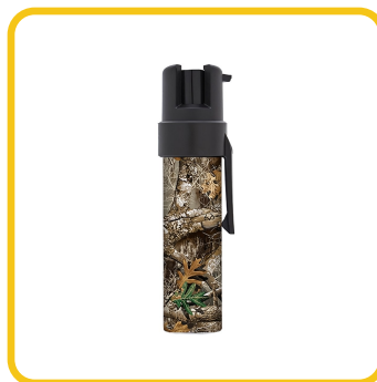
Militar / Camo