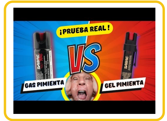
Video: guía de gas y gel de pimienta — @ArmasMS