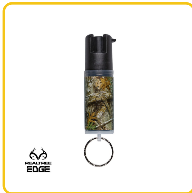
Spray Pimienta SABRE Red · Funda de Llavero como Realtree EDGE — 14 g — disponible en armasmys.com