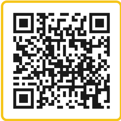
Escanea para ver la guía de gas y gel de pimienta

¿Gas, gel o espuma? ¿Chorro o cono? En nuestro canal @ArmasMS te explicamos las diferencias y cómo elegir el indicado. Escanea el código: